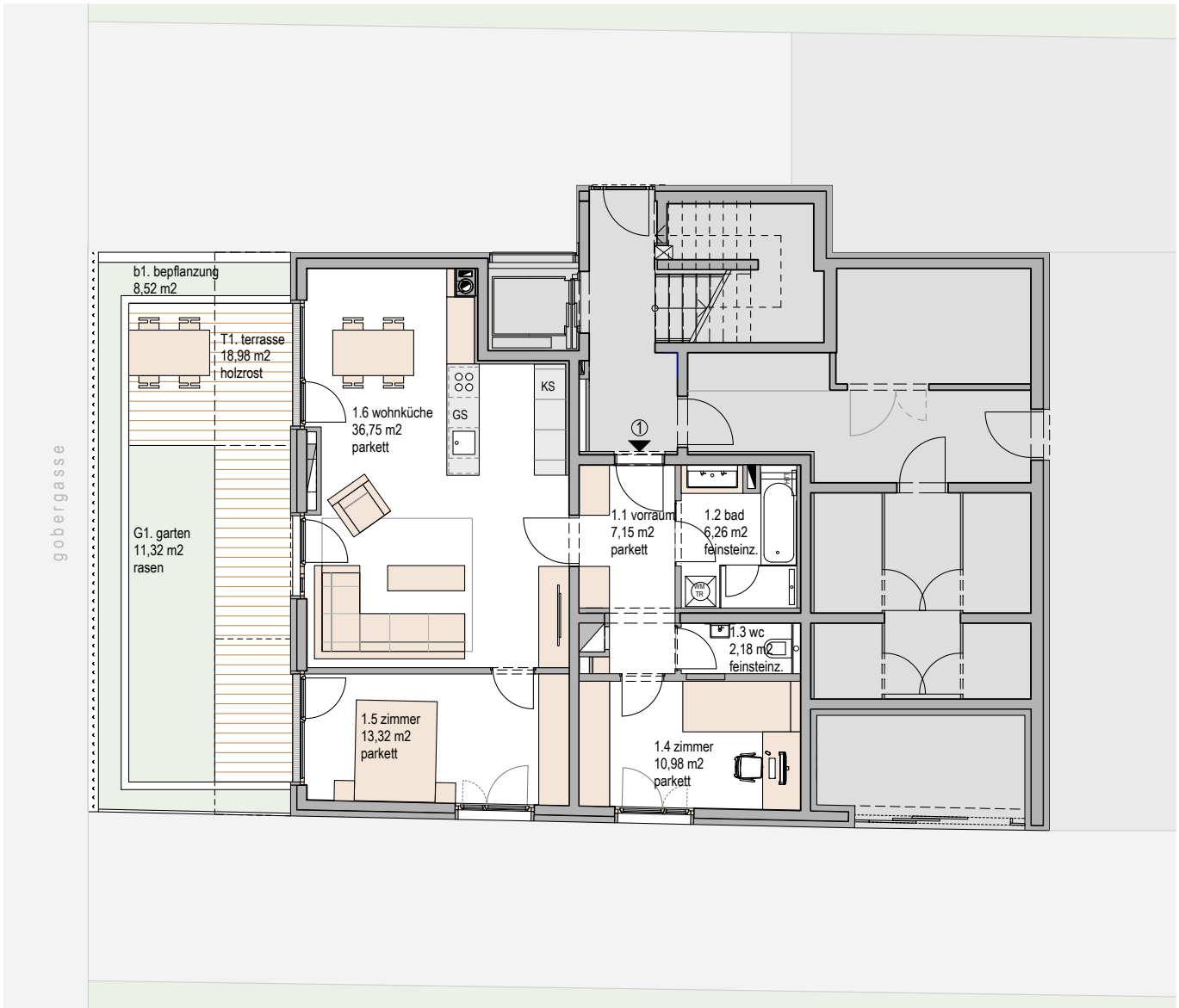
ERDGESCHOSS TOP 1